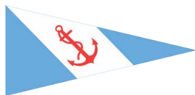
YACHT CLUB ARGENTINO