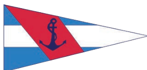
YACHT CLUB PUNTA DEL ESTE